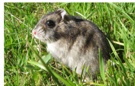
For at give dværghamstere mere motion og nye undersøgelsesmuligheder kan tamme individer tages ud i f.eks. en løbegård, hvor det er let at holde øje med dem og sikre, at de ikke undslipper. Husk dog på at dværghamstere graver godt!

Selvom hamstervat findes i handlen, kan hamstere risikere at vikle sig ind i det, miste lemmer og kvæles.