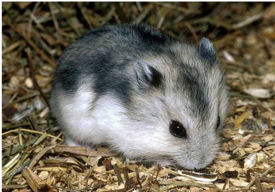
Vinterhvid dværghamster ( Phodopus sungorus ) er én af de tre ægte dværghamster-arter, der holdes i fangenskab.